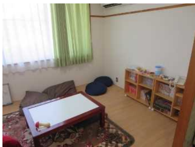
～合宿入院参加者のための部屋～

入院費用（健康保険が適用されます）とおやつや生活必需品やレクリエーションなどの費用をご負担いただきます。世帯の収入や健康保険の種類などによっては費用は異なりますので、詳細は当院の地域医療連携部にお問い合わせください。