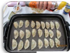
～調理レクリエーション～