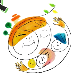
認知症疾患医療センター ロゴマーク

日時 平成 29 年 9 月 13 日 (水) 15 : 00 ~ 16 : 30