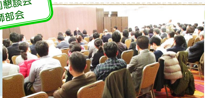
職種別懇談会 医師部会

【児童思春期病棟における人材育成・看護力の底上げについて】 【多職種間の情報共有と統一した関わりについて】 【入院患者の性教育についての現状と問題点】